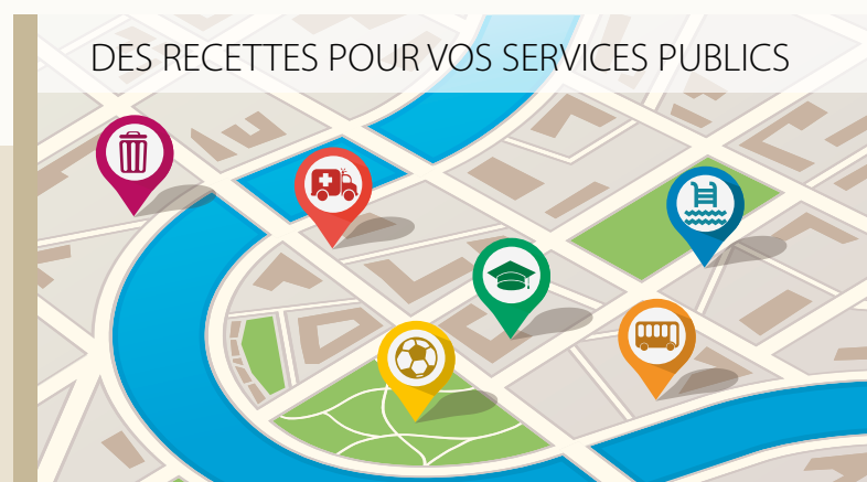
DES RECETTES POUR VOS SERVICES PUBLICS

avoir gelé sa dotation, l'État vient de décider d'une baisse de 3 milliards d'euros pour 2015. Les prestations non-compensées par l'État pour le handicap, les personnes âgées et le RSA s'élèvent aujourd'hui à 6 milliards. Elles devraient même dépasser les 8 milliards en 2016 ! Il y a trois ans, Nicolas Sarkozy supprimait la taxe professionnelle. Si cela a été une très bonne nouvelle pour les entreprises, les collectivités territoriales ont vu leurs finances mises en péril. Elles ont alors été contraintes de faire augmenter les impôts locaux des particuliers et/ou de réduire